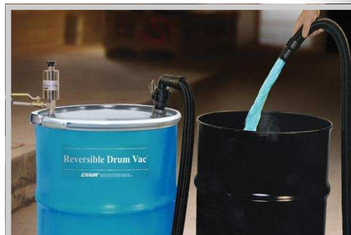
Modellen 6901 brukes med Drum Vac'en for å raskt tømme et fat med kjemikalier (90 sek)

Elektriske "all around" støvsugere er ikke designet for å bli brukt i industrielle miljø. Som et resultat slites motorene fort ut og viftene tettes. Den Vendbare Drum Vac'en bruker ikke strøm og har ingen bevegelige deler, noe som gir vedlikeholdsfri drift. En automatisk Nødavstengningsbryter hindrer søl eller overfylling.