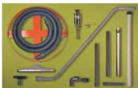
Modell 6296, utstyr som er inkludert