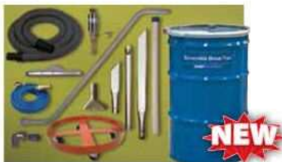
Modell 6396, utstyr som er inkludert