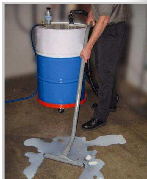
Modellen 6901 brukes med Drum Vac'en for å raskt samle opp væskesøl