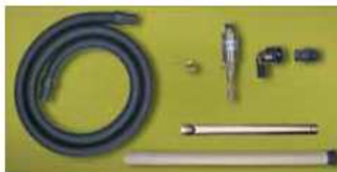
Modell 6196, utstyr som er inkludert